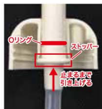
図2 ノズル引き上げ

ノズルをストッパーが止まるまでしっかりと引き上げてください。リングが隙間を塞いで水漏れや水圧の低下を防止します。