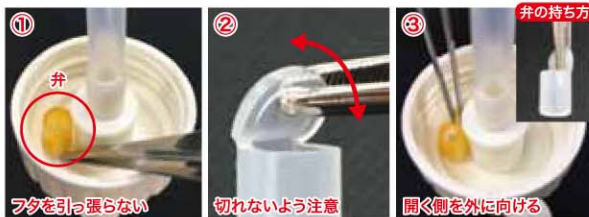
図1 弁のフタの開閉確認