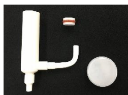
⑯パイプ交換セット

パイプ内部やOリングは水アカやカビの他、劣化の心配があります。定期的なお手入れや消毒に加え、3年に1回《パイプ交換セット》の交換をお勧め致します。