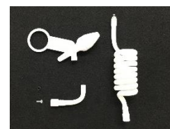
⑰ノズル・ホース交換セット

ノズル・コイルホース・L字ホースの内部は水アカやカビの心配があります。定期的なお手入れや消毒に加え、1年に1回《ノズル・ホース交換セット》の交換をお勧め致します。