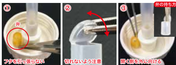
図1 弁のフタの開閉確認